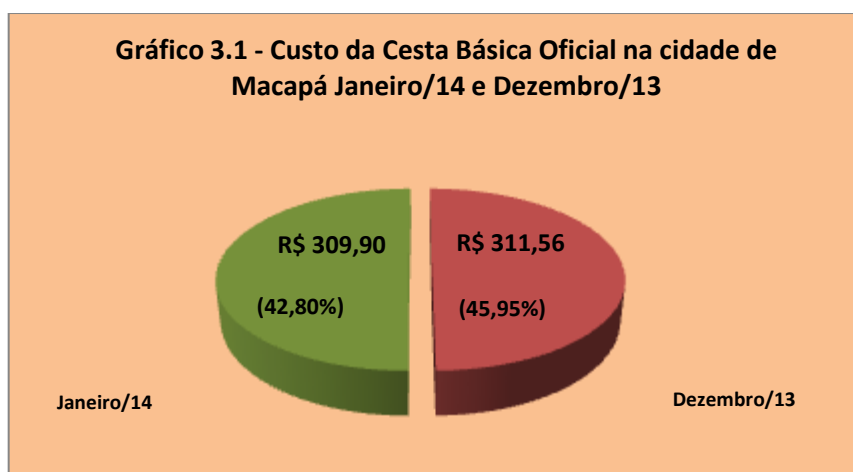
Gráfico 3.1 - Participação da Cesta Básica Oficial no Salário Mínimo

(*) A Cesta Básica representa os gastos com alimentação de um trabalhador adulto (Decreto Lei nº 399/38 de 30.04.1938)