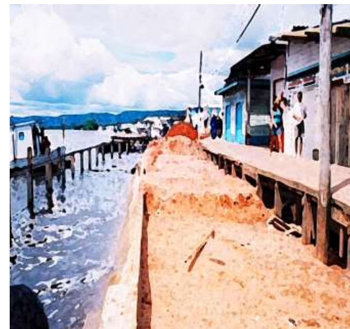
Frete da Cidade