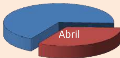
Gráfico 04- Custo da Cesta Básica Regional Março 2013

■ Participação percentual do valor da cesta básica regional com referência ao poder de compra de 06 salários mínimos líquidos (R$ 3.752,32) 67,30%