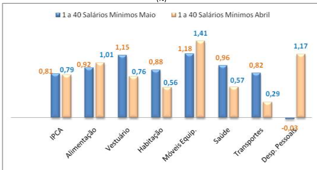
Gráfico 2 - Variação do Índice de Preço ao Consumidor da Cidade de Macapá no intervalo de rendimento entre 1 a 40 Salários Mínimos, variação mensal de Maio/16 e Abril/16 (%)

O grupo Despesas e Serviços Pessoais foi a menor variação ficando com -0,03%, se comparada com o mês anterior onde foi de (1,17%),houve uma queda significativa de 1,20pp. Os Subgrupos com maiores quedas foram: serviços pessoais -4,22% e cerimônias familiares e religiosas -2,31%. Os itens negativos foram: e cerimônias familiares e religiosas-6,10%, joalheiro -6,47% e massa de modelar -5,49%. Os subgrupos positivos foram: artigo de papelaria 3,40% e leitura 2,50% e os itens positivos foram: livros 13,49%, boneca 6,95% e relojoeiro 6,00%.