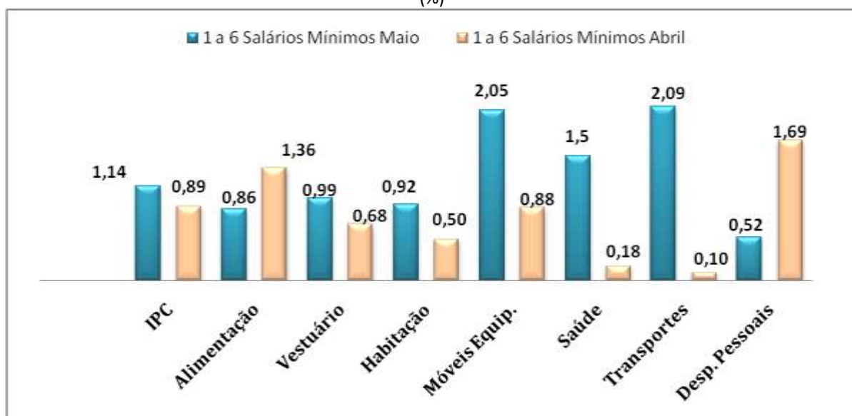
Gráfico 1 - Variação do Índice de Preço ao Consumidor da Cidade de Macapá no intervalo de rendimento entre 1 a 6 Salários Mínimos, variação mensal de maio/16 e Abril/16 taxas acumuladas (%)

O grupo Despesas e Serviços Pessoais apresentou a menor variação 0,52%, comparado com o mês de abril (1,69%) houve uma queda de - 1,17 (p.p). O Subgrupos negativos foram: despesas e serviços pessoais -5,30% e fumo -1,61%. Os itens negativos foram: funeral -11,67%, manicure e pedicura -4,55% e revelação de fotos -3,58%.