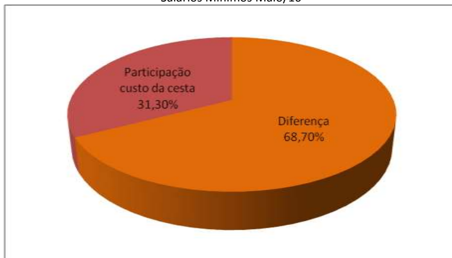
Gráfico 4 – Participação percentual do Valor da Cesta Regional em relação a 6 Salários Mínimos Maio/16