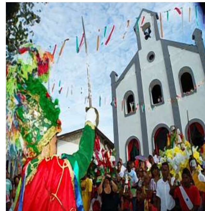
Festa de São Thiago