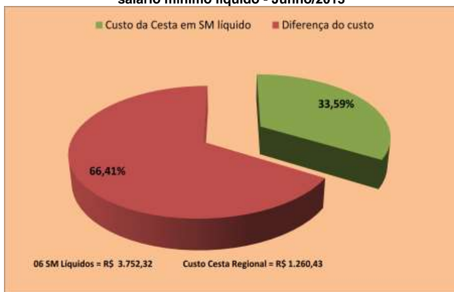
Gráfico 4 - Participação Percentual do Valor da Cesta Básica Regional em salário mínimo líquido - Junho/2013

Já em Artigos de Limpeza e Manutenção do Domicílio os itens detergente (5,47%), sabão em pó (11,90%) e fósforo (11,27%) apresentaram altas em seus preços médios. Enquanto água sanitária (-7,11%), palha de aço (-1,53%) e cera pastosa (-1,57%) tiveram queda em seus preços médios.