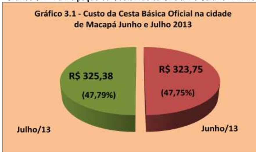
Gráfico 3.1 - Participação da Cesta Básica Oficial no Salário Mínimo